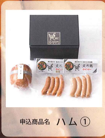
申込商品名 ハム ①

秋田県大館市産比内地鶏を使用した、こだわりの鶏ハム&ウインナーを全国の皆様へお届けします