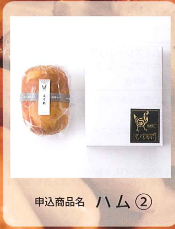
申込商品名 ハム ②