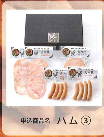
申込商品名 ハム ③