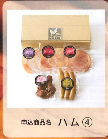
申込商品名 ハム ④

お申込みは、郵便局備え付けのカタログ販売申込書(一般用A)と一緒に郵便窓口または郵便局社員へお申付けください (一部簡易郵便局は取扱いを行っていません)。 本チラシと申込書(お客様控え)はセットでお客様控えとなりますので、商品到着まで大切に保管してください。